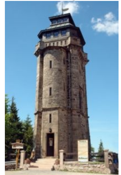
Auersberg-Turm (1869), der älteste Turm seiner Art in Sachsen

Auf dem Berg lockt ein Verpflegungspunkt, an dem man sich auch mit Getränke reserven eindecken kann. Doch um den zu erreichen, muss man auf den nun folgenden 6 Kilometern einen Höhenunterschied von 265 Metern überwinden! Den Aussichtsturm auf dem Auersberg