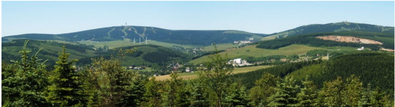
Panoramablick mit Fichtelberg (und kleinem Fichtelberg) sowie dem Klinovec (auf tschechischer Seite)

Diese Etappe ist wohl der härteste Abschnitt des Marathons. Auf einer Strecke von weniger als 6km müssen die Teilnehmer und Teilnehmerinnen eine Höhendifferenz von rund 300 Metern überwinden, um zum 1213 Meter hoch gelegenen Rastplatz zu gelangen. Dort allerdings gibt es dann wieder eine (sicher wohlverdiente) Verpflegungspause.