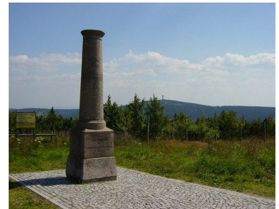
Blick vom Fichtelberg zum Klinovec, mit Meridiansäule.

Nicht nur für Radsportler lohnt sich eine Rundreise auf der gezeigten Route, denn alle Orte haben ihren Reiz und ihre Attraktionen.