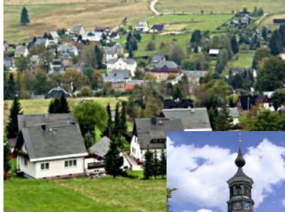
Carlsfeld: Trinitatiskirche (älteste sächs. Rundkirche)