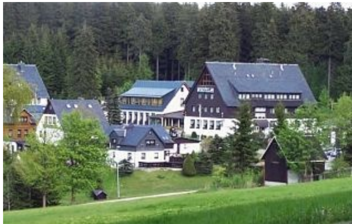
Blick zum Ferienhotel Mühleithen http://www.ferienhotel-muehleithen.de

Im Jahre 1787 erstmals beurkundet und wurde 1992 dem Nachbarort Klingenthal eingemeindet. Es ist zwischen Kiel (946) und Aschberg (Gipfel in Tschechien, auf 936, in Deutschland 920), auf ca. 855m, an der B283 gelegen.