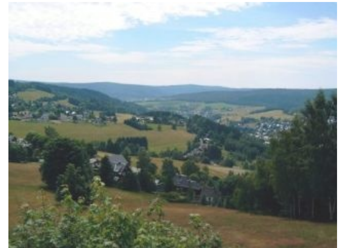
Blick vom Aschberg in Richtung Klingenthal

Mühleithen ist einer der namhaftesten vogtländischen Wintersportorte. Die nur 177 Einwohner zählende Ortschaft ist