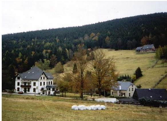
Wildenthal, am Fuße des Auersbergs

erreicht man damit allerdings noch nicht, denn der liegt in 1019m Höhe. Auch er belegt, als ältester seiner Art in Sachsen, die historische Bedeutung der Marathon-Route.